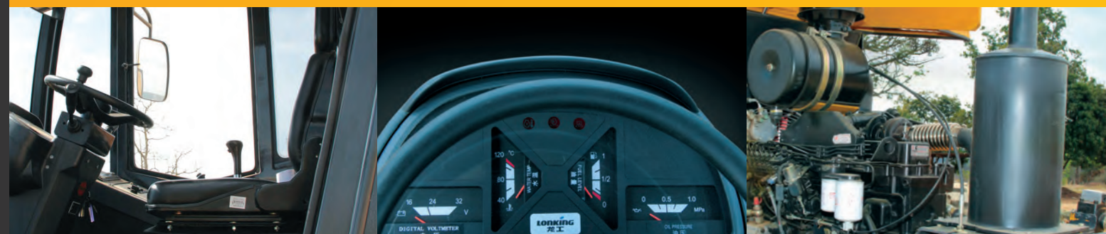
Cabine com ar condicionado